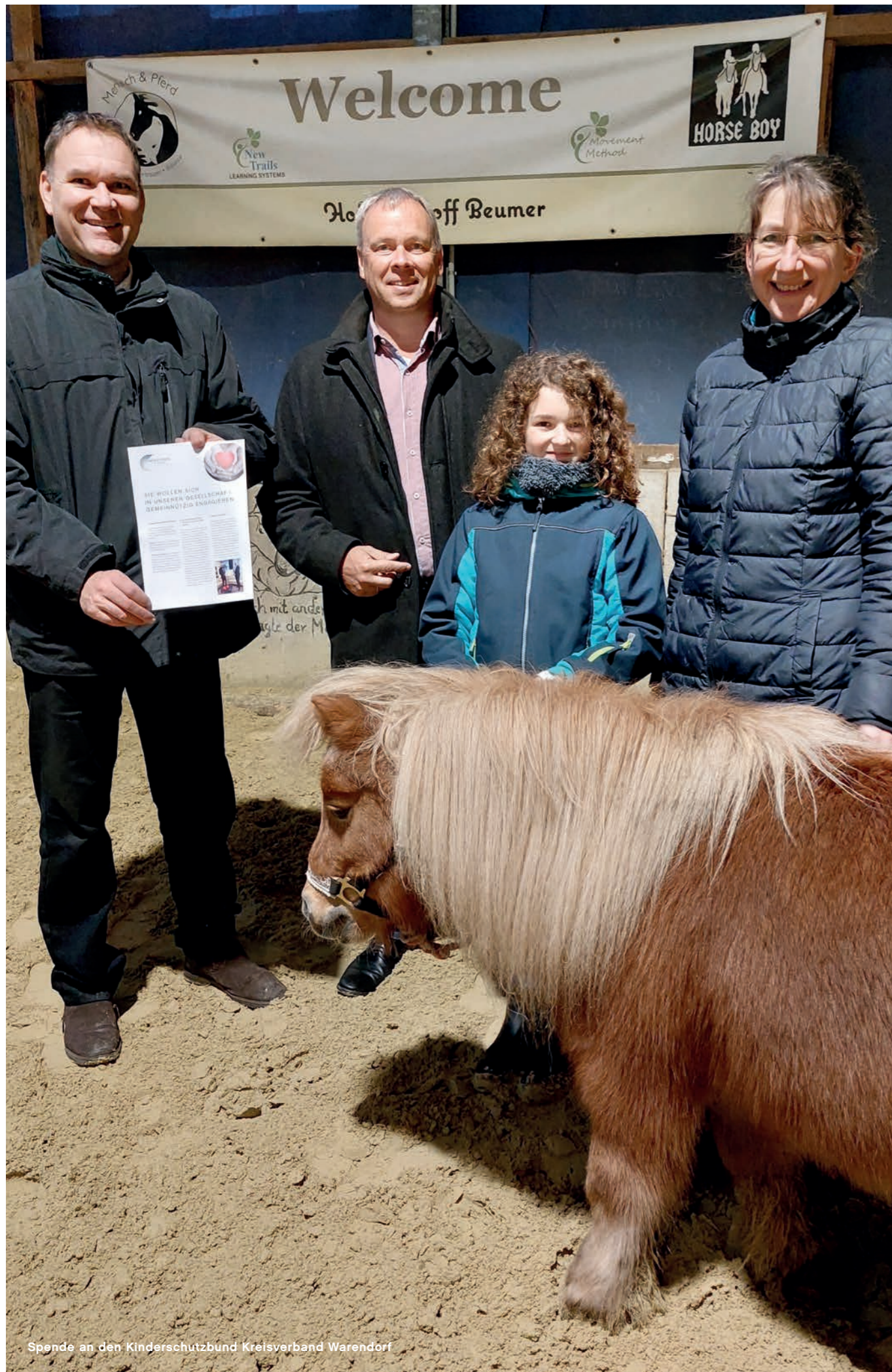
Spende an den Kinderschutzbund Kreisverband Warendorf